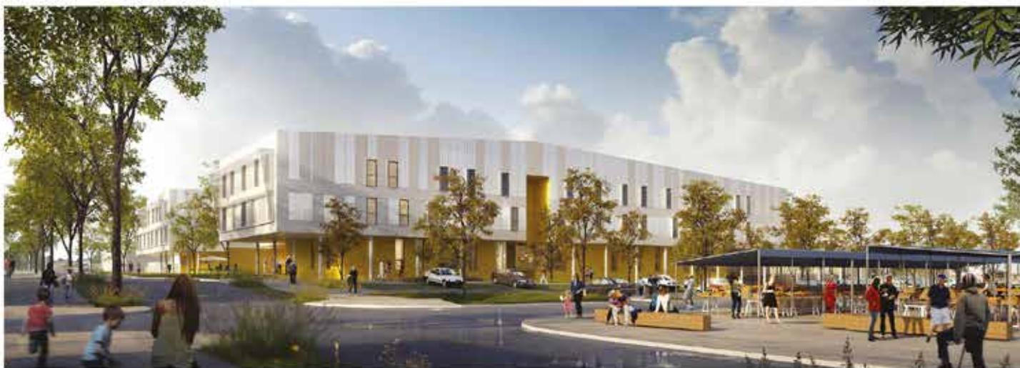
PERSPECTIVE. Intégration de l'EHPAD dans le quartier vue de l'allée Seurat depuis le futur pôle de services

A La Bastide, un nouvel établissement pour personnes âgées dépendantes (EHPAD) verra le jour en 2020. Ce projet, financé par le Centre communal d'action sociale de la Ville de Limoges, permettra tout d'abord d'apporter aux résidents des offres d'hébergement et de soins contemporaines avec des chambres individuelles : 120, chacune étant équipée d'un cabinet de toilette indépendant. Les travaux débuteront en septembre 2018, allée Seurat.