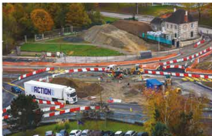
BOULEVARD SCHUMAN. Les travaux vont bon train

Les travaux de réaménagement de la nouvelle entrée de ville et de quartier conduits par la Ville de Limoges ont débuté depuis la mi-octobre.